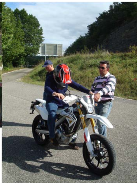
Atelier passage de vitesse