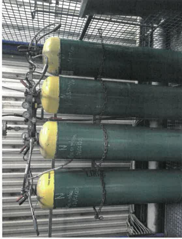
Annexe obligatoire : photo du stockage d'ammoniac au traitement thermique