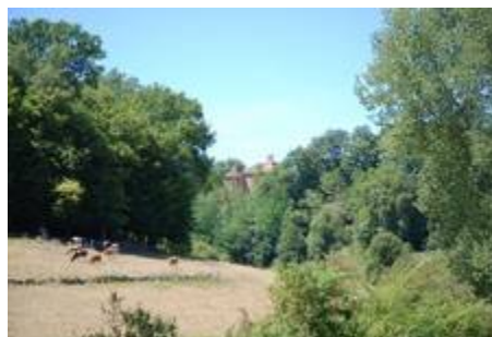
Trois moulins existaient au 19ème siècle au fil de la Masse