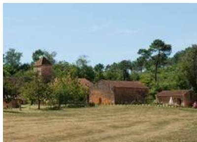
Le Boussagou et la silhouette élancée du pigeonnier