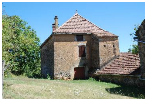
Ente Cap de Gat et Boussagou