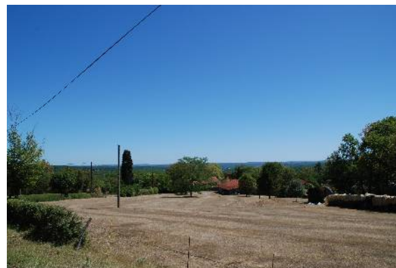
Arrivée sur le village de Benauges avec vue dégagée vers le gourdonnais