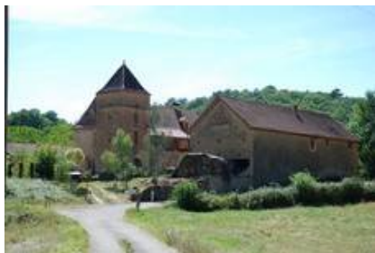
Le Brel haut