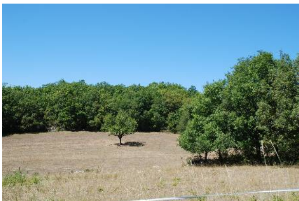
Environs de Boissierette

2 – le causse de Florimont Gaumier : il s'agit du plateau caussenard situé au nord est de la commune, re-découpé par le ruisseau de Bénauges et les combes de Bru qui se rattachent au bassin versant du Céou. Ce causse est parcouru d'une ligne de crête de direction nord-ouest/sud-est et présente une altitude moyenne proche de celle du plateau bourian. Elle ménage des vues dégagées vers le gourdonnais.