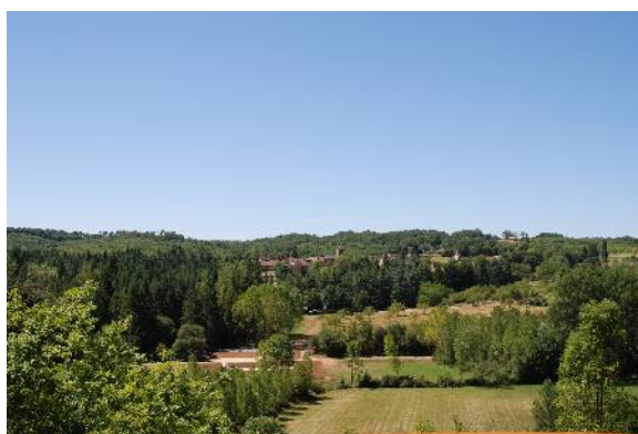
Emergence de Marminiac dans le couvert boisé