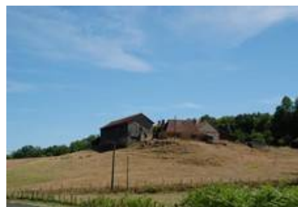
Pomette sur une croupe en surplomb de la Masse