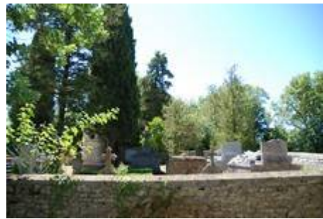
Cimetière et chapelle de Boisserettes. Les vitraux de la chapelle ont été créés par JE Bissières