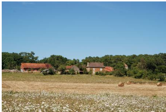
Hameau de la Catine et clairière agricole

2 – le causse de Florimont Gaumier : il s'agit du plateau caussenard situé au nord est de la commune, re-découpé par le ruisseau de Bénauges et les combes de Bru qui se rattachent au bassin versant du Céou. Ce causse est parcouru d'une ligne de crête de direction nord-ouest/sud-est et présente une altitude moyenne proche de celle du plateau bourian. Elle ménage des vues dégagées vers le gourdonnais.