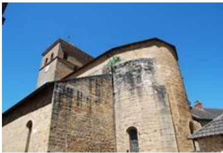
Eglise fortifiée de Saint Vincent