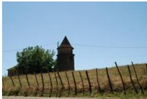
Roquecave, restes d'un ensemble fortifié au moyen âge, corps de logis reconstruit selon style 17ème