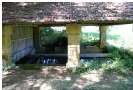
Lavoir de la Masse