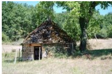
Cabane dans la vallée de la Masse