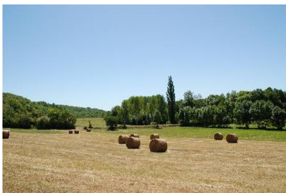
Cultures et ripisylve de la vallée de la Masse

1a - La vallée de la Masse, peu profonde et fortement boisée, dont les versants dissymétriques témoignent d'une nature géologique différente. En rive droite, la marge du plateau est déstructurée par plusieurs ruisseaux affluents de la Masse : elle présente des versants aux pentes douces qui donnent une ouverture à la vallée et accueillent l'habitat. En rive gauche, les pentes du versant nord, taillé dans le roc, forment un escarpement plus difficile à franchir sur lequel l'habitat ne peut s'implanter.