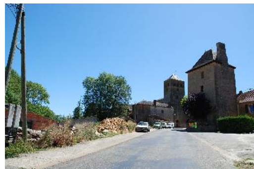
entrée de Marminiac : tour vestige du château fort du 15ème