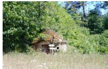
Cabane au cap de Gat