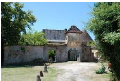
La romiguière, remarquable pour son pigeonnier porche, existence attestée depuis la fin 15ème