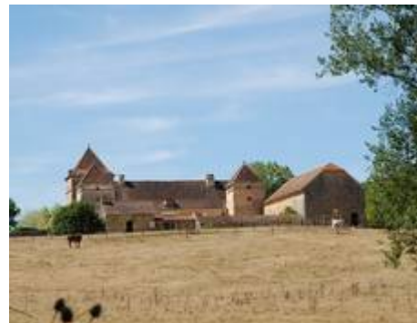
Bouteille haut, ferme des 17ème et 18ème siècle, monument historique inscrit depuis 1995