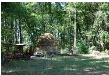
Cabane à Lacoste