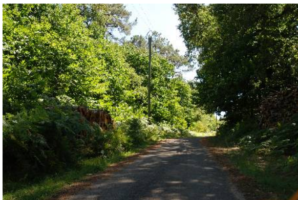
Route forestière du plateau bourian

1b- Le plateau bourian : c'est le plateau qui occupe la moitié ouest de la commune, dont il comporte les points hauts (les Davalans à 342m). Il est couvert par les sables et calcaires gréseux du tertiaire, c'est pourquoi il supporte d'importants boisements de châtaigniers. Concernant l'urbanisation, il présente un semis de hameaux agricoles formant des clairières cultivées dans la masse boisée.