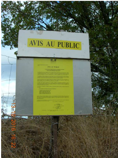
Détail d'un panneau d'affichage.