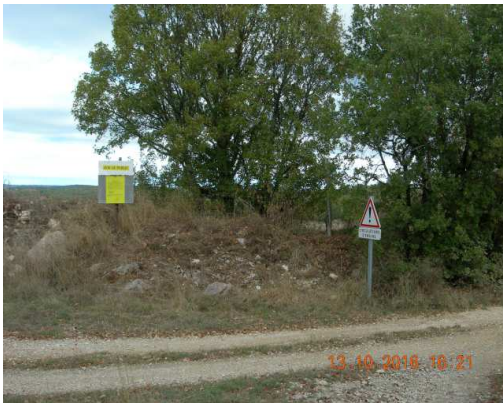
Panneau 3 : en bordure du chemin rural de la Bastide du Vert à Cahors.