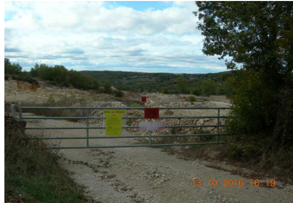
Panneau 4 : accès sud.