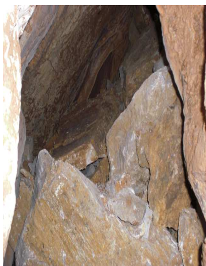
Fig. 4. Étroiture.