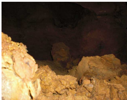
Fig. 5. Salle.