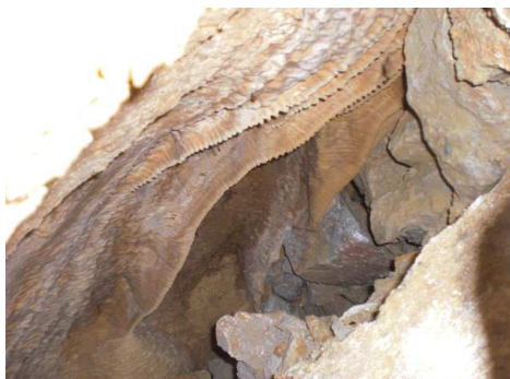
Fig. 3. Derrière l'entrée.