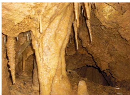
Fig. 6. Fond cavité.