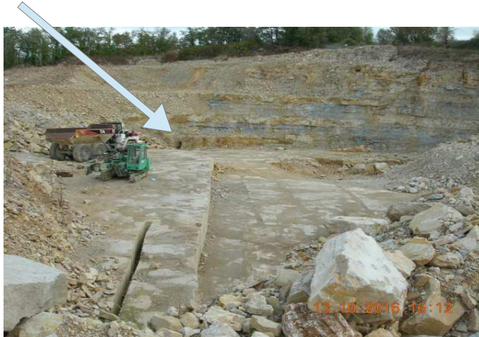
Fig. 1. Localisation.