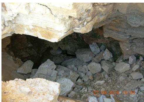
Fig. 2. Entrée.