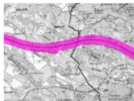
Zones exposées au bruit – type « C » – Ln