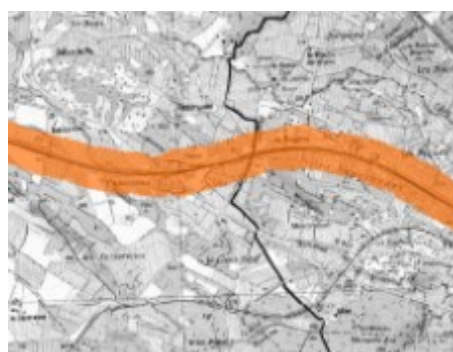
Zones exposées au bruit – type « C » – Lden