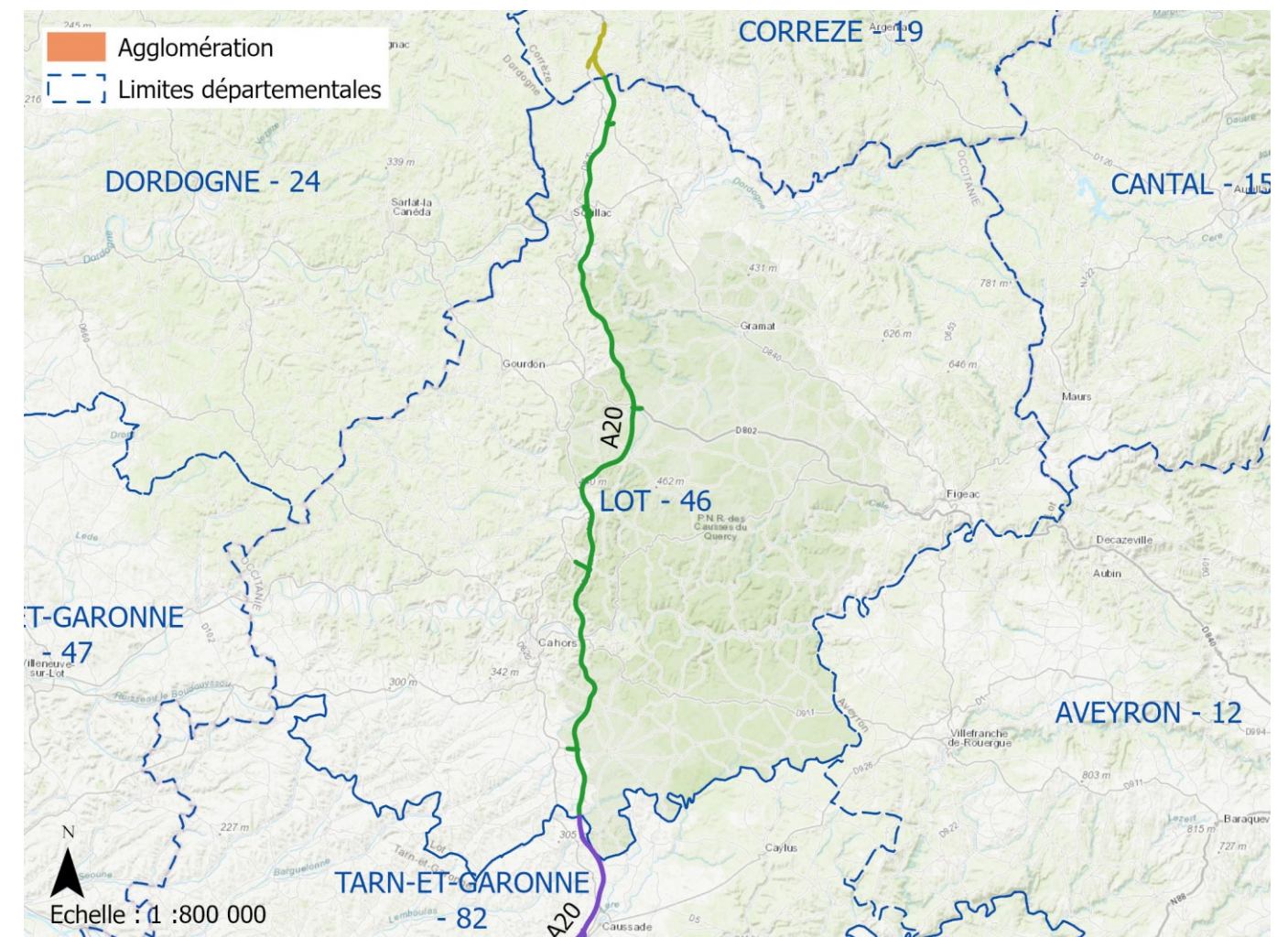
Carte du réseau autoroutier concerné

Par ailleurs, l'autoroute A20, entre le PR 285 et le PR 429 est étudiée dans le cadre des cartographies réalisées pour les départements de la Corrèze, du Tarn-et-Garonne.